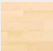
Sélect et Meilleur